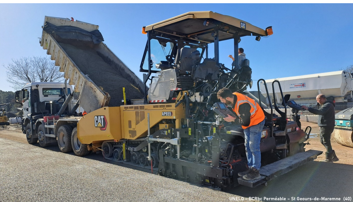
UNELO - BCRbc Perméable - St Geours-de-Maremne (40)