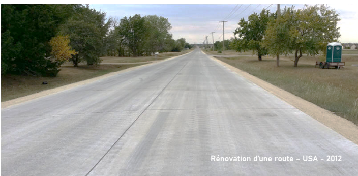
Rénovation d'une route - USA - 2012