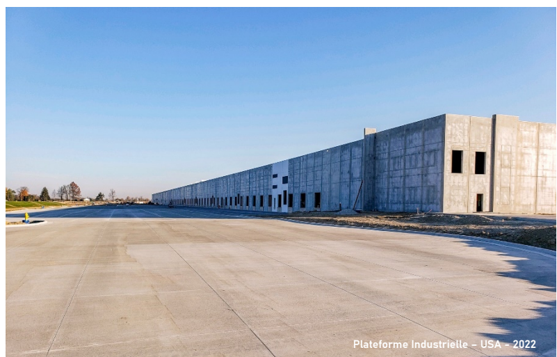
Plateforme Industrielle - USA - 2022