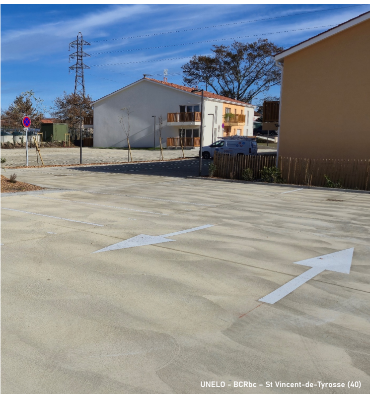
UNELO - BCRbc - St Vincent-de-Tyrosse (40)

Possibilité de réaliser l'ensemble des finitions d'un béton conventionnel (désactivation, ponçage, grenailage, bouchardage...)