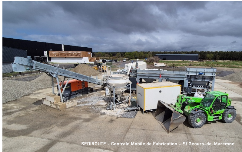
SEDIRROUTE - Centrale Mobile de Fabrication - St Geours-de-Maremne

UNELO® porte la compétence de mise en œuvre avec l'équipe la plus expérimentée sur le BCR en France avec déjà plusieurs dizaines de milliers de m 2 réalisés. Elle s'appuie notamment sur un finisseur adapté de dernière génération d'un système électronique de précision, il garantit une application uniforme à haute vitesse. Grâce à une largeur pouvant atteindre 7,4 m, il a démontré toute son efficacité aussi bien sur des chantiers de petite que de grande envergure.