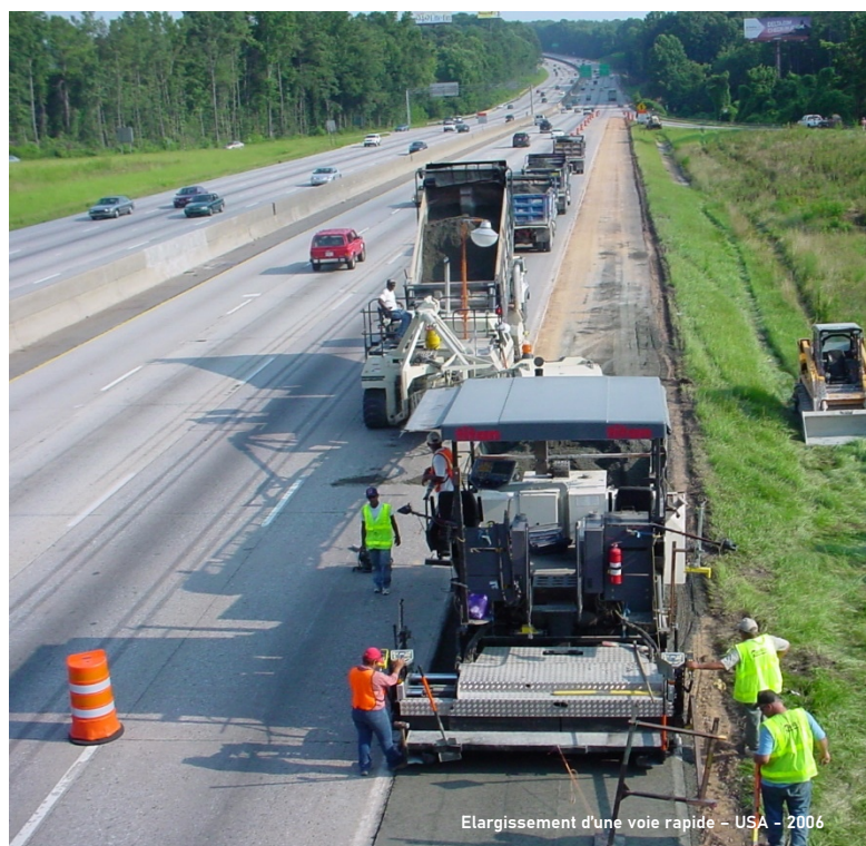
Elargissement d'une voie rapide - USA - 2006

Une solution éprouvée : Depuis, le BCR a été utilisé dans des milliers de projets à travers le monde, pour des routes, des zones logistiques, des plateformes industrielles ou encore des aires portuaires et aéroportuaires.